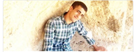
Ne yaparsa yapsınlar, yiğitlerimizin yanındayız