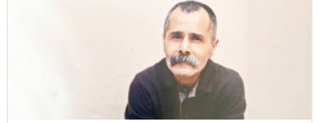
Abimi sessizlik öldürmesin