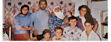
Vartinis'in yanık kokusu

Mahatma Gandhi: Evet. Sizden farklı olarak, biz şehitlerin özel bir söz hakkına sahip olduğu kendi kendini yöneten öbür dünyamızda -Martin Luther King ve İsa da burada bu arada!- Dünyadaki tüm kitaplara erişimim var ve sizin cesur hareketiniz hakkında